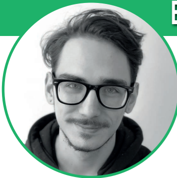
a cura di Andriy Frankevych Development Department IntraWeb srl www.intraweb.it

protegge, con l'ambizione di riuscire, un giorno, a sostituire Facebook e Instagram