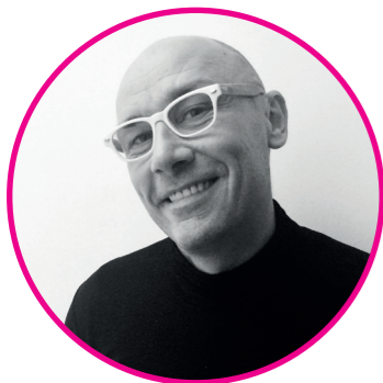
a cura di Marco Perico CEO&FOUNDER IntraWeb srl www.intraweb.it

Fiducia e volontà di socializzare con nuove persone sono alla base del nuovo modo di